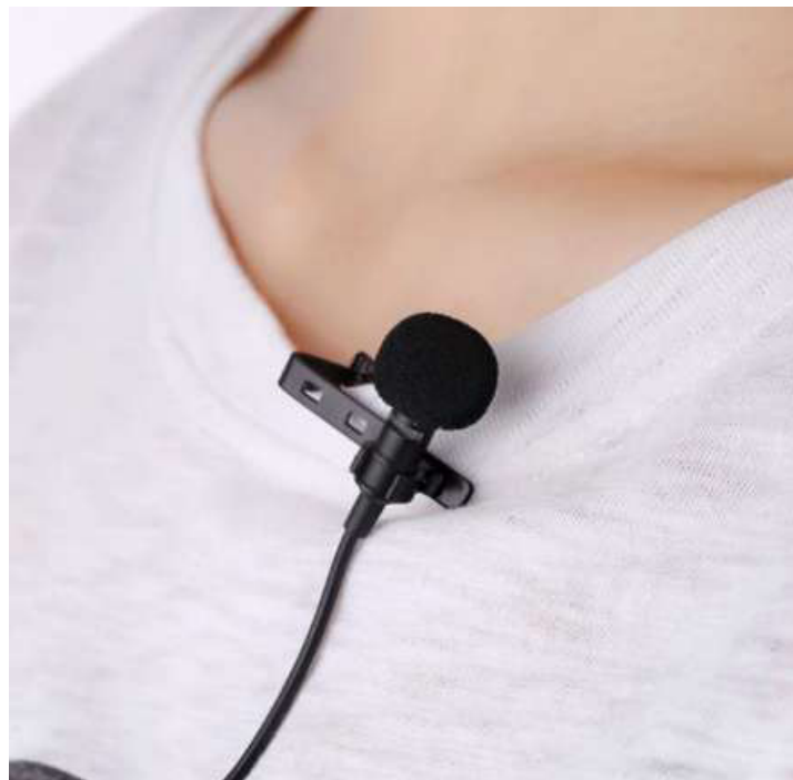
Пример крепления петличного микрофона на одежде

Отключите перед съёмкой все приборы, которые могут издавать шум (часы, кондиционер, мобильные телефоны). Перед записью интервью проверьте и прослушайте тестовую запись звука.