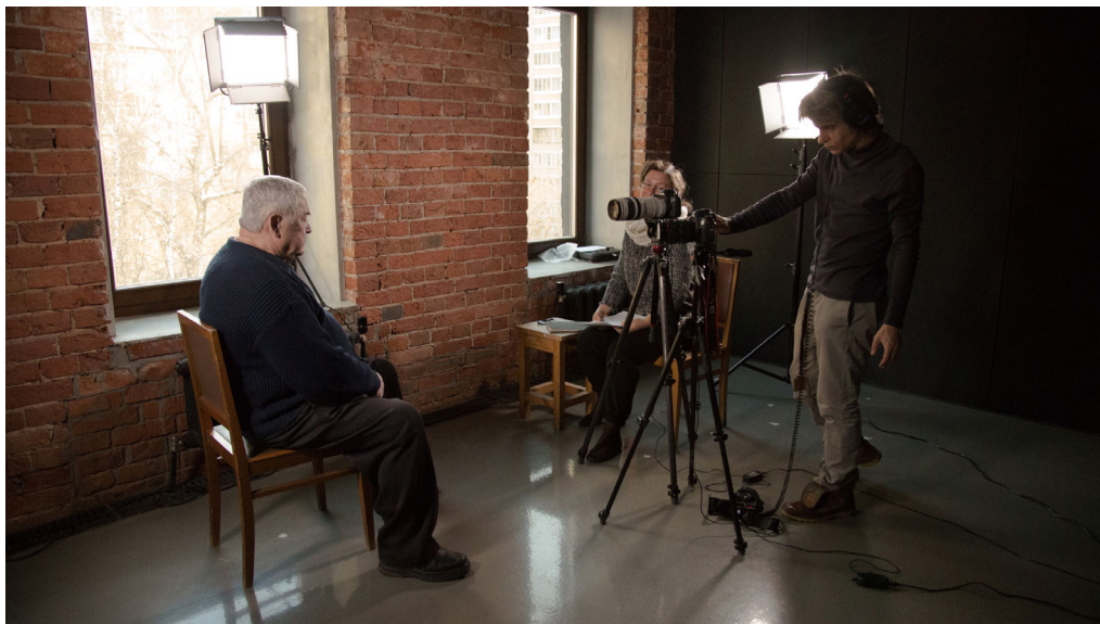
Съёмка в Студии визуальной антропологии Музея истории ГУЛАГа

Сделайте в кадре акцент на герое. Постарайтесь убрать из кадра отвлекающие детали. Проследите, чтобы респонденту было удобно сидеть в течение всего интервью.