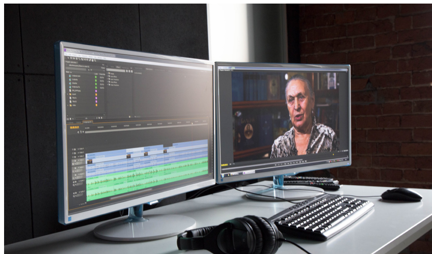
Монтажный компьютер в Студии визуальной антропологии

Для использования материала на выставках и в интернет-проектах Музею необходимо получить соглашение о передаче интервью, подписанное респондентом, с оговоренными условиями публикации и доступа к материалам исследователей, а также соглашение, подписанное авторами видео, о праве его использования. Соглашения отправляются дополнительно по электронной почте.