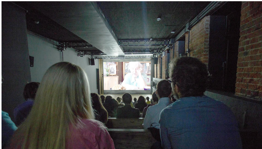
Показ интервью из проекта «Мой ГУЛАГ»

Данное пособие создано для людей и организаций, готовых записывать интервью в рамках проекта «Мой ГУЛАГ» Музея истории ГУЛАГа. В нём содержатся рекомендации по самостоятельной видеосъёмке для частных лиц, программы опросов для семи категорий возможных респондентов и стандартное техническое задание для съёмки профессиональными съёмочными группами.